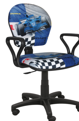
MARKO F1 NIEBIESKIE