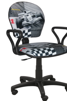
MARKO F1 SZARE