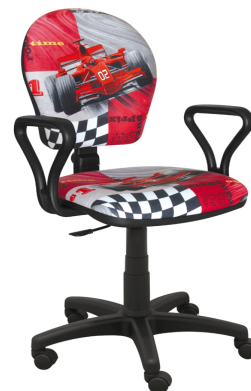
MARKO F1 CZERWONE