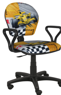
MARKO F1 ŻÓŁTE