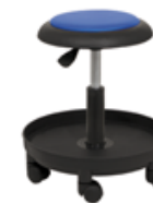
TOBY T RBL