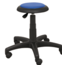
TOBY T BL