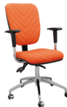
TORINO V AL