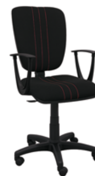
TORINO P3 BL