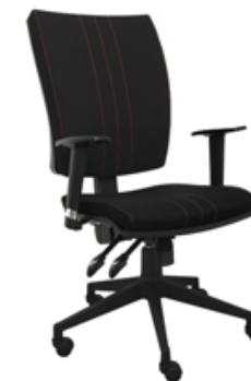
GOBLIN P BL