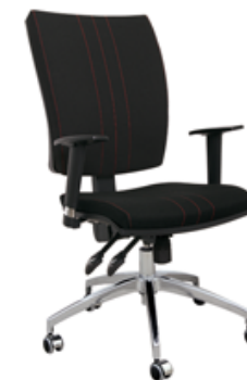
GOBLIN P AL