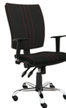
GOBLIN P CH