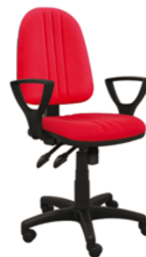
BRED P3 SYNCHRO BL