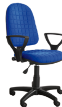
BRED K BL