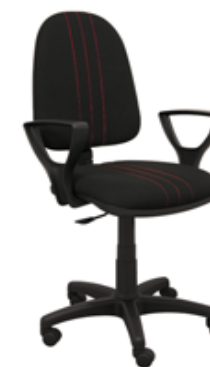
BRED P3 BL