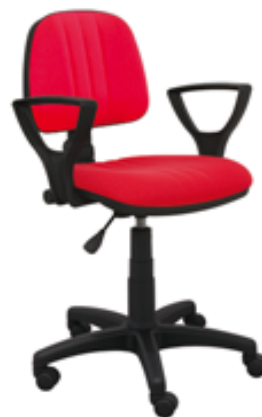
BASTEK P3 BL