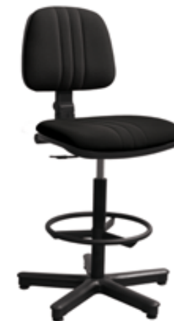
BASTEK P3 W